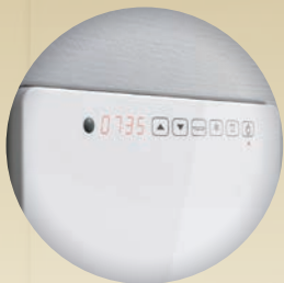
タッチパネル操作部