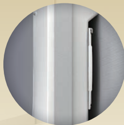
洗えるフィルター