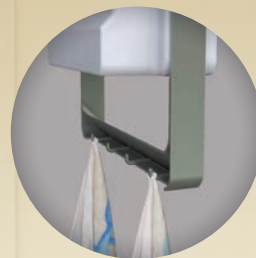
隠しタオルフック